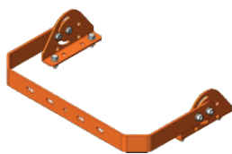
Support poteau 1 SBT-PLB240-O/G