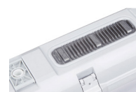
Tableau de commande