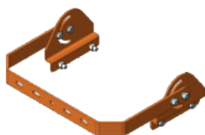
Lyre de fixation orientable SBT-PLB80-0/G